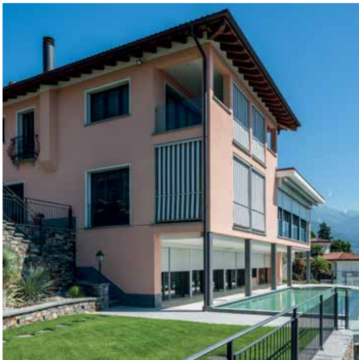
Regasicur® dans des environnements où la sécurité est nécessaire et appréciée.